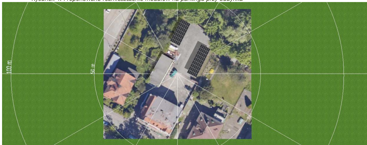
Rysunek 4. Proponowane rozmieszczenie modułów na parkingu przy budynku