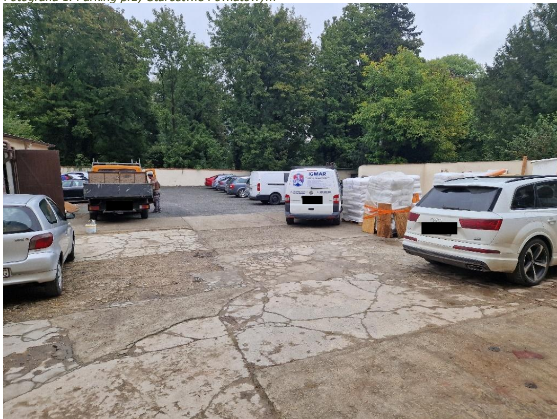
Fotografia 1. Parking przy Starostwie Powiatowym

Budynek jest wpisany do Wojewódzkiej Ewidencji Zabytków.